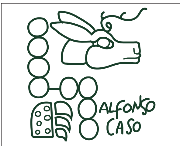
Ex-libris de Alfonso Caso, el cual representa al Señor 8 Venado “Garra de Tigre”, Rey de la Mixteca de la II Dinastía de Tilantongo. Personaje del Mapa de Tezacoalco, estudiado por Caso en 1949