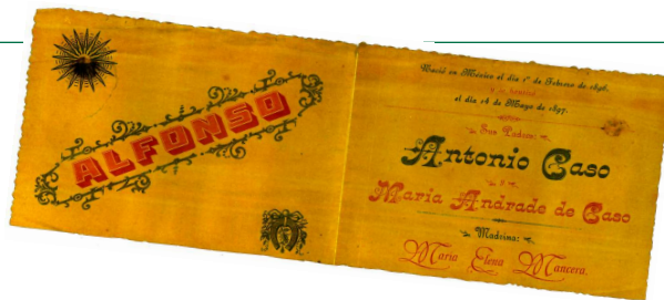
Bolo de bautizo, 1897