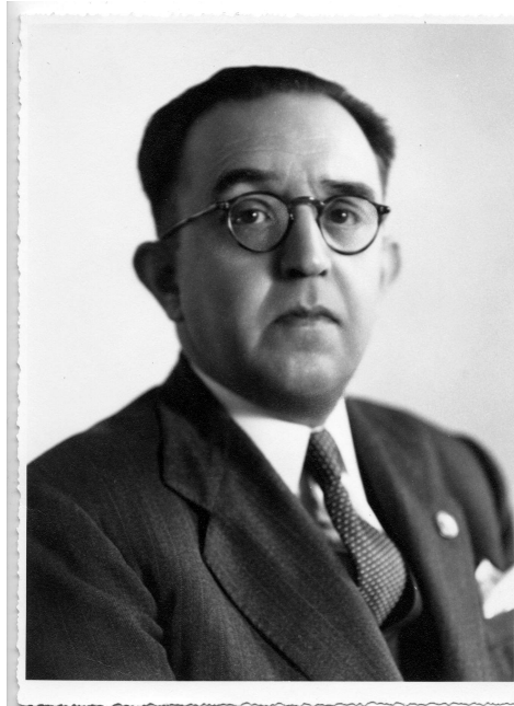
Dr. Alfonso Caso Andrade

Hemos decidido incluir en el primer número del Boletín una semblanza de Don Alfonso Caso con motivo de ser el primero de febrero el aniversario de su natalicio, y quien, además, presta su nombre a esta Área. Asimismo incluimos el diagnóstico realizado a los diferentes grupos documentales, el cual es un instrumento técnico que nos permite detectar su grado de organización y planear las futuras actividades del Área, mismas que van encaminadas a poner a disposición de los interesados los diferentes fondos.