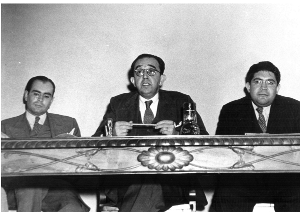
El Lic. Alfonso Caso presidiendo la Primera Junta de Gobierno de la Universidad Nacional, acompañado del Lic. García Maynez y del Dr. Carrillo Flores

Fue miembro de varias instituciones internacionales y de muchas de ellas recibió honores y distinciones.