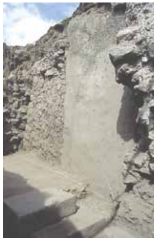
FIGURA 2.16. Subestructuras E102A (a la izquierda) y E102B (a la derecha) en el núcleo de E2.

En la cala epiclásica de saqueo se observó la presencia de dos subestructuras: una (E102A) tuvo escalones monolíticos de piedra y la otra (E102B), un gran talud ( figura 2.16 ).