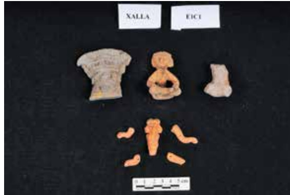
FIGURA 2.8. Figurillas de la ofrenda AA78B, hallada en la Estructura 1 de Xalla.