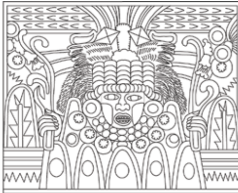
FIGURA 2.19. Dios del monte (pintura mural que yace en el Denver Art Museum). Redibujada por Rubén Gómez Jaimes.

la estructura estuviese dedicada a la “deidad del cerro” (figura 2.19) que estudió Zoltán Paulinyi (2009), por los diversos fragmentos de montañas grandes de cerámica (figura 2.20) que hallamos dentro de las fosas de saqueo, a diversas alturas y en distintos cuadros, así como en el sector doméstico al este de E3, como un ritual de terminación. Sin embargo, en esta porción sur de C1 se localizó el remanente de un altar, en el cuadro N317 E367, en donde se cree que estaba empotrada la escultura antropomorfa que se encontró desmembrada sobre el piso y dentro de la fosa principal de saqueo.