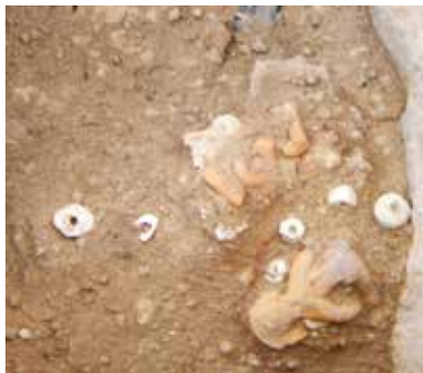
FIGURA 2.10. Figurilla masculina sedente boca abajo, separada de una desarticulada por una hilera de cuentas (ofrenda AA78B).

En la figura 2.10 observamos uno de los niveles de la ofrenda no saqueada (AA78B), con una línea de cuentas que separa una figurilla masculina sedente, con la cara contra el piso, de una desarticulada (probablemente femenina), quizás sugiriendo una oposición masculino/femenina.