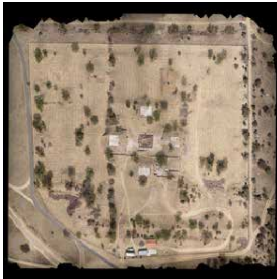
FIGURA 2.1. Fotografía aérea del complejo palaciego de Xalla.

El complejo palaciego de Xalla (Manzanilla 2008, 2017a) se localiza al norte de la plataforma en “U” de la Pirámide del Sol, después de una explanada; es un palacio fundado hacia 160 dC, ubicado en el corazón de la ciudad de Teotihuacan, entre las dos pirámides principales, a 235 m de la Pirámide del Sol y de la Calzada de los Muertos. Xalla tiene 29 edificaciones y 8 amplias plazas (Manzanilla y López Luján 2001) (figuras 2.1, 2.2 y 2.3). Vale la pena mencionar que al menos una docena de los montículos visibles desde la superficie rebasan los 4 m de altura.