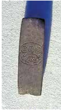
FIGURA 2.15. Pequeña estela con el símbolo del dios de la lluvia.

En la cala epiclásica de saqueo se observó la presencia de dos subestructuras: una (E102A) tuvo escalones monolíticos de piedra y la otra (E102B), un gran talud ( figura 2.16 ).