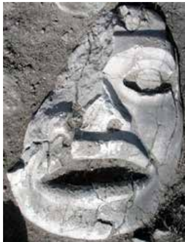
FIGURA 2.18. Cara de la escultura antropomorfa de mármol hallada en la Estructura 3 de Xalla.

Es posible que el recinto estuviese almenado, pues dentro de las fosas epiclásicas de saqueo obtuvimos fragmentos de almenas. Asimismo, es posible que