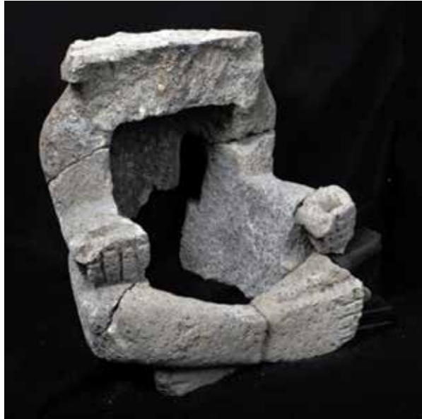
FIGURA 2.28. Cuerpo de una gran escultura rota en pedazos del dios del fuego, hallada en E3E C8.

Otro pasillo grande (E3E C8) que originalmente unía a la Plaza 1 con la Plaza 5 (ubicado al oriente de este sector), y cuyo piso estuvo pintado de rojo y rosa, fue relleno con piedras, entre las que se encontraron varios fragmentos de un dios del fuego (figuras 2.28 y 2.29) más grande que el de la Estructura 1.