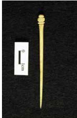
FIGURA 2.32. Fistol de hueso trabajado procedente de Xalla.

Se detectaron varios objetos de hueso trabajado en Xalla (véase el capítulo 11 de este volumen), entre los que destacan fistles ( figura 2.32 ) y emblemas de grupos sociales ( figuras 2.33 y 2.34 ).