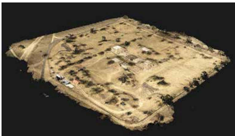
FIGURA 2.2. Fotografía oblicua del complejo palaciego de Xalla.