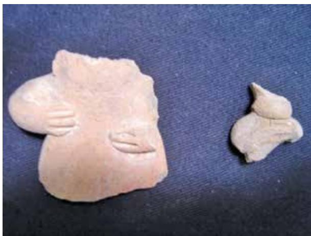
FIGURA 2.7. Figurillas embarazadas con las manos en el pecho, halladas en la Estructura 1 de Xalla.

Asimismo, en la Estructura 1 se hallaron varias figurillas femeninas embarazadas y con las manos en el pecho (figura 2.7).