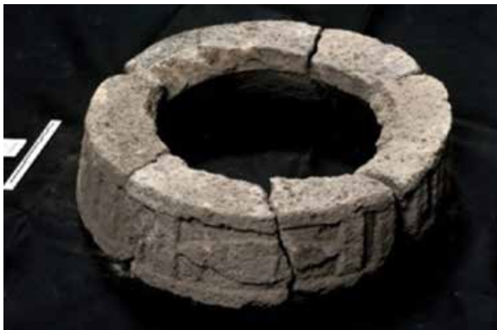
FIGURA 2.29. Fragmentos de la cazoleta del dios del fuego, hallados en E3E C8.

En el sector noroeste de Xalla yace la Estructura 12, un túmulo ritual anexo a un posible muro perimetral original del complejo palaciego. Allí se encontraron muchas láminas y objetos de mica, así como aplicaciones de incensarios tipo