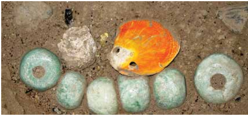
FIGURA 2.21. Cuentas de jadeíta del valle del Motagua en Guatemala, como parte de la ofrenda fundacional de Xalla.

A pesar de contar con morillos carbonizados, producto del gran incendio de Teotihuacan (véase capítulo 5 de este volumen), encima de su piso (Z = 2 307.069 msnm), no contuvo restos de esculturas en su recinto. Sin embargo, al profundizar en las fosas superiores de saqueo de los grupos epiclásicos, hallamos una ofrenda fundacional de Xalla, fechada hacia 160 dC (véase capítulo 5 de este volumen) (figuras 2.21 y 2.22), con grandes cuentas de jadeíta del Motagua (Ruvalcaba Sil et al. 2008).