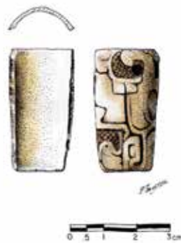
FIGURA 2.12. Hueso excavado hallado en la fosa de saqueo de la Estructura 1. Dibujo de Fernando Botas.

Los grupos epiclásicos (Coyotlatelco) saquearon varios recintos de Xalla, así como E2 y el templo central (E9). En la cima de la Estructura 1 se halló una gran fosa de saqueo, misma que reexcavé. En ella (véase capítulo 3 de este volumen) hallé un hueso excavado con motivos mayas tempranos (figura 2.12) (Guillermo Bernal, comunicación personal).