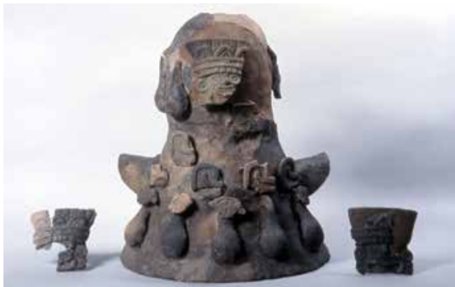
FIGURA 2.14. Tapa de incensario tipo teatro con tlaloques y gotas de agua.