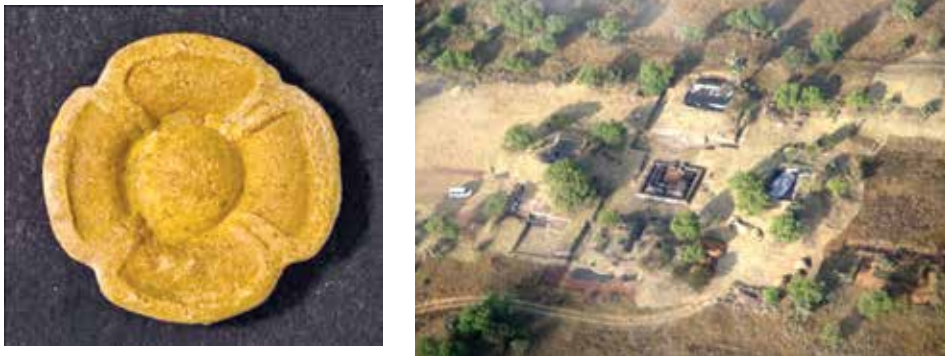
FIGURA 2.4. En la figura 2.4A se ve la flor de cuatro pétalos en cerámica y en la figura 2.4B, la Plaza 1 de Xalla, con las cuatro estructuras a los puntos cardinales y el templo en el centro. Fotografías de Rafael Reyes y Marcos Silva.

Los recintos a los puntos cardinales desplegaron elementos iconográficos relativos a diversas deidades: el del este estuvo relacionado directamente con el dios de las tormentas; el del norte, con el dios del fuego y con deidades de la fertilidad femenina; el del sur, con el dios del monte, y el del oeste, probablemente con la diosa de las aguas. A continuación describiremos cada una de estas estructuras.