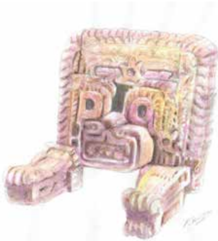
FIGURA 2.13. Felino monumental saliendo de un portal (actualmente se encuentra en el Museo Nacional de Antropología). Acuarela de Fernando Botas.

Esta estructura, con fachada al oeste, estuvo dedicada al dios de la lluvia. Fundamentamos esta interpretación a partir de la decoración de la fachadaa con felinos monumentales que salen de un portal (figura 2.13), que es una representación también relacionada con la fachada de la Pirámide del Sol. En el recinto se halló la tapa de un incensario decorado con tlaloques y gotas de lluvia (figura 2.14), y en su cara sur se halló una pequeña estela con el símbolo abstracto del dios de la lluvia (figura 2.15).