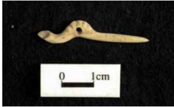
FIGURA 2.34. Otra insignia zoomorfa, procedente de Xalla.

No quisiéramos dejar de mencionar la gran cantidad de puntas de proyectil y cuchillos curvos de diversos tamaños hallados en Xalla (figuras 2.35 y 2.36).