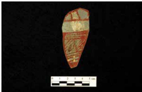
FIGURA 2.31. Lámina pintada de pizarra hallada cerca de una ofrenda de conchas marinas, mica y cuentas, en el pasillo entre las dos subestructuras de E12.

Asimismo, cerca del tepetate, en el pasillo entre las dos subestructuras de E12, se halló otra ofrenda más de conchas y caracoles marinos asociados a cuentas y a placas de mica. Cerca de esta ofrenda se halló una lámina completa de pizarra, pintada con blanco, rojo y gris (figura 2.31).