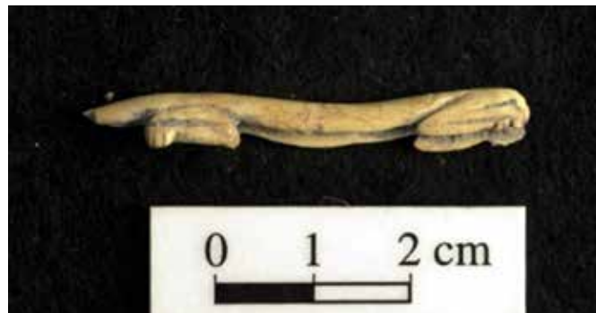
FIGURA 2.33. Felino hecho de hueso, procedente de Xalla.