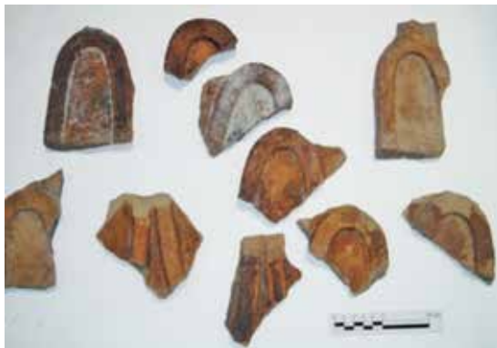
FIGURA 2.20. Montañas de cerámica, posiblemente parte del altar del dios del monte de la Estructura 3.

La Estructura 4 cierra la Plaza 1 por el oeste. El largo de la fachada fue de 22.95 m, y el ancho de la escalinata, de 7.35 m. En la fachada oeste sólo tuvo un talud. Se conservó la escalinata, pero con una fosa de saqueo Coyotlatelco y su consecuente círculo de piedras. Como las demás estructuras de la Plaza 1, tuvo un recinto (C1 de E4) y un pórtico (C2 de E4). El Cuarto 1 de la Estructura 4 es una gran sala con pilastras, de 11.20 m de largo por 9.60 m de ancho. Cuenta con un