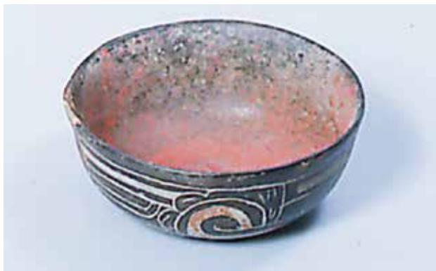
FIGURA 2.23. Cuenco con cinabrio procedente del AA43 de la Plaza 5.

Sabemos que Xalla contuvo pinturas murales, pero éstas fueron desprendidas en los saqueos de pintura mural que asolaron Teotihuacan al principio de los años sesenta del siglo xx. Los pigmentos preparados y aplicados con instrumentos de piedra diversos muestran mezclas complejas (véase capítulo 6 de este volumen). En una fosa cavada en el tepetate, ubicada en la esquina noreste de la Plaza 5, se halló una vasija foránea, quizás procedente del Occidente de México, con cinabrio (figuras 2.23 y 2.24), así como varias porciones de figurillas que quizás evidencien un ritual de desmembramiento (figura 2.25).