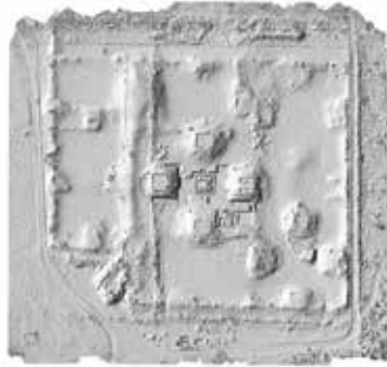
FIGURA 2.3. Tratamiento de la imagen de Xalla con dron.

Entre las características de este complejo que nos indican que posiblemente fue una de las sedes gubernamentales teotihuacanas, destacan las siguientes: Xalla tiene un tamaño inusual en el contexto de Teotihuacan, pues ocupa una superficie aproximada de 55 000 m 2 ; está enclavada en un sector antiguo y en el corazón de la ciudad, en una posición que le otorga privacidad, ya que no está sobre la Calzada de los Muertos, el eje principal de la ciudad; está comunicada directamente con la Plaza de la Luna a través de un camino elevado de unos 5 m de ancho; tiene un masivo muro limítrofe con paso de ronda para los vigilantes del palacio; el palacio está integrado, como se mencionó, por un total de 29 edificaciones y 8 amplias plazas. Originalmente contuvo murales que fueron saqueados en los sesenta del siglo pasado, ya que hallamos las monedas y los recipientes de los alimentos de los responsables.