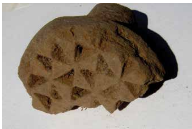
FIGURA 2.6. Sello con dobles conos, emblema del dios del fuego, hallado en la Estructura 1.

Estuvo dedicada al dios del fuego y a una probable deidad de la fertilidad femenina. En su piso quemado en el gran incendio de 575 dC se halló un Huehue-téotl incompleto (figura 2.5), con fragmentos de la figura esparcidos esparcidos en otros cuadros, como sucede con la mayor parte de la escultura del sitio. Asimismo, se halló un sello con dobles conos, emblema del dios del fuego (figura 2.6).