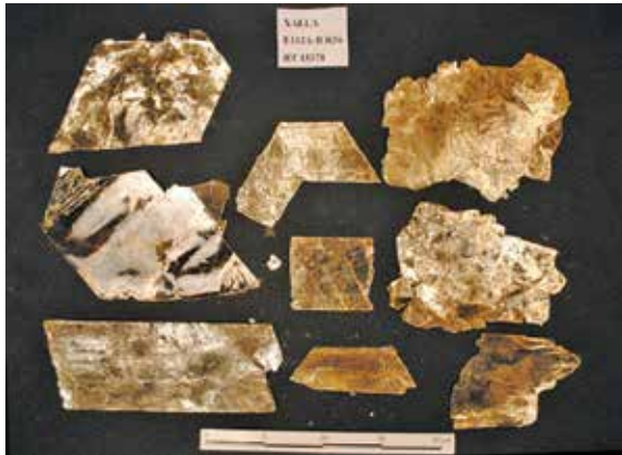
FIGURA 2.30. Placas de mica atesoradas en el pasillo entre las dos subestructuras de la Estructura 12.

teatro (entre las que se cuentan varias flores de cuatro pétalos), objetos varios (instrumentos de hueso, puntas de proyectil, etcétera), cuentas de piedra verde, dispuestos sobre dos subestructuras (E112A y E112B). En el pasillo E-W entre las subestructuras se dispusieron placas grandes de mica con cortes geométricos (figura 2.30), algunas de las cuales pesaron 600 gramos.