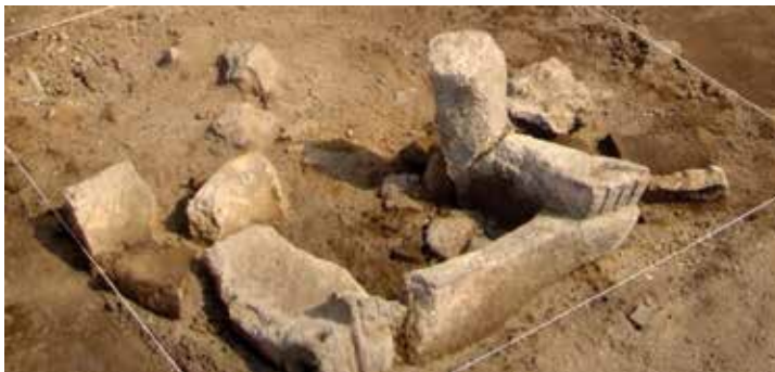
FIGURA 2.5. Escultura incompleta de un Huehuetéotl sobre el piso del incendio.

La Estructura 1, ubicada en la porción norte de la Plaza 1, tuvo una fachada al sur; no hemos hallado aún la escalinata. El recinto superior (C1) de la Estructura 1 tuvo 11.5 m de largo E-W (P1 E1 C1 N376-385 E361-372); se halló un pórtico (C2) hacia el sur, separado de C1 por un vano de 3 m de ancho. No tuvo muro posterior (norte), que suponemos fue eliminado por saqueo de pinturas murales en los años sesenta (se halló una lata de sardinas y una moneda de 1964 en la esquina noroeste y los muros del recinto tenían saqueos a intervalos regulares). El recinto contó originalmente con dos pilastras, de las cuales quedó la fosa y algo de la madera. Su piso estuvo ubicado a Z = 2\,307.12\text{--}2\,307.306 msnm, por lo que la altura del recinto rebasó los 4 metros.