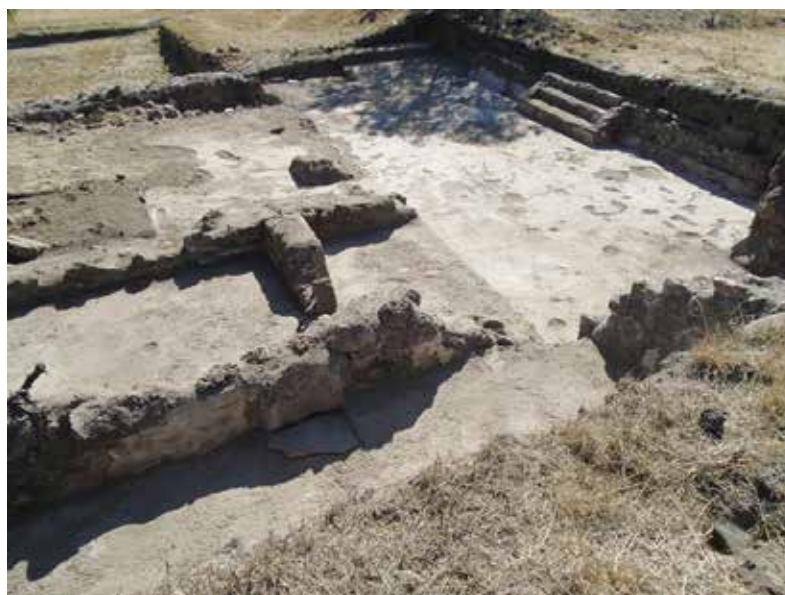
FIGURA 2.27. Plaza elevada, pórticos y cuartos del sector doméstico al este de la Estructura 3. Fotografía de Linda R. Manzanilla.

Un pasillo (E3E C1) de este sector tuvo varias almenas escalonadas acomodadas sobre el piso, por lo que pensamos que hubo un ritual de terminación asociado a este sector.