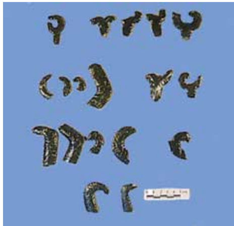
FIGURA 2.35. Algunos ejemplos de cuchillos curvos de Xalla.

No quisiéramos dejar de mencionar la gran cantidad de puntas de proyectil y cuchillos curvos de diversos tamaños hallados en Xalla (figuras 2.35 y 2.36).