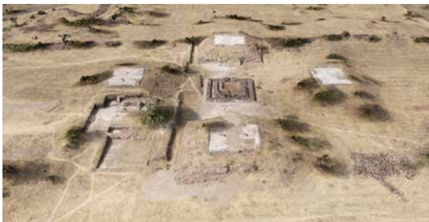
FIGURA 2.26. Plaza 1 de Xalla con el sector doméstico anexo a la Estructura 3. Fotografía oblicua proporcionada por Geneviève Lucet y su equipo a mi proyecto.

la Estructura 3. En esta sala de audiencia es probable que un funcionario supervisase la labor de los lapidarios, ya que se hallaron cuatro cuentas de su collar, cada una de ellas de un material distinto (como si fuese un muestrario) y un sello con doble círculo.