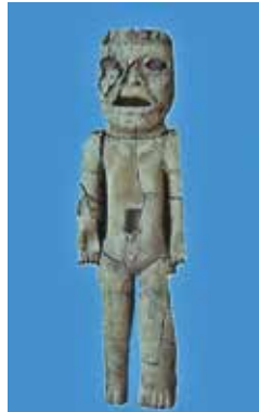
FIGURA 2.17. Escultura antropomorfa hallada en pedazos en la cima de la Estructura 3 de Xalla, correspondiente al gran incendio de Teotihuacan (actualmente en el Museo Nacional de Antropología). Museo Nacional de Antropología.

Encima del piso y dentro de la fosa epiclásica de saqueo se hallaron fragmentos de una gran escultura antropomorfa que actualmente se encuentra en el Museo Nacional de Antropología (figuras 2.17 y 2.18).