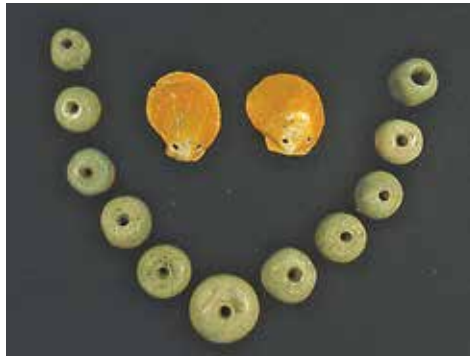
FIGURA 2.22. Collar de cuentas de jadeíta del Motagua con conchas de Spondylus .

Entonces, supongo que la Estructura 4 pudo estar dedicada a la diosa del agua, otro aspecto de la fertilidad relacionado con cuentas de piedra verde y conchas marinas.