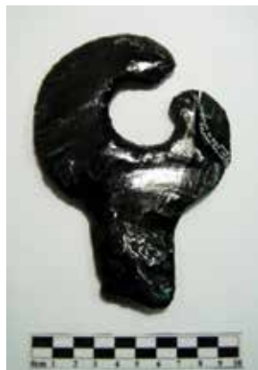
FIGURA 2.36. Gran cuchillo curvo en proceso, hallado en la Plaza 5 de Xalla.