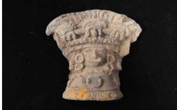
FIGURA 2.11. Figurilla entronizada hallada en la ofrenda de la Estructura 1.

En dicha ofrenda de la Estructura 1 se halló también una figurilla entronizada (figura 2.11).