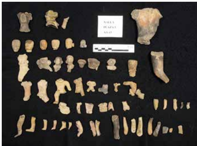
FIGURA 2.25. Posible ritual de desmembramiento de figurillas del AA43 de la Plaza 5.

Desde el año 2012 hasta el presente descubrí un sector doméstico (figuras 2.26 y 2.27) anexo a la Estructura 3 ubicada en la porción sur de la plaza principal y dedicada probablemente al dios del monte. Este sector tuvo una plaza elevada (E6B) respecto de la Plaza 1, con escalinata hacia el sur; cuartos y pórticos en el margen septentrional y una especie de sala de audiencia hacia el oeste, pegada a