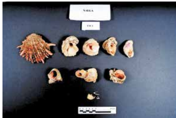
FIGURA 2.9. Conchas marinas asociadas a las figurillas de la figura anterior.

En la figura 2.10 observamos uno de los niveles de la ofrenda no saqueada (AA78B), con una línea de cuentas que separa una figurilla masculina sedente, con la cara contra el piso, de una desarticulada (probablemente femenina), quizás sugiriendo una oposición masculino/femenina.