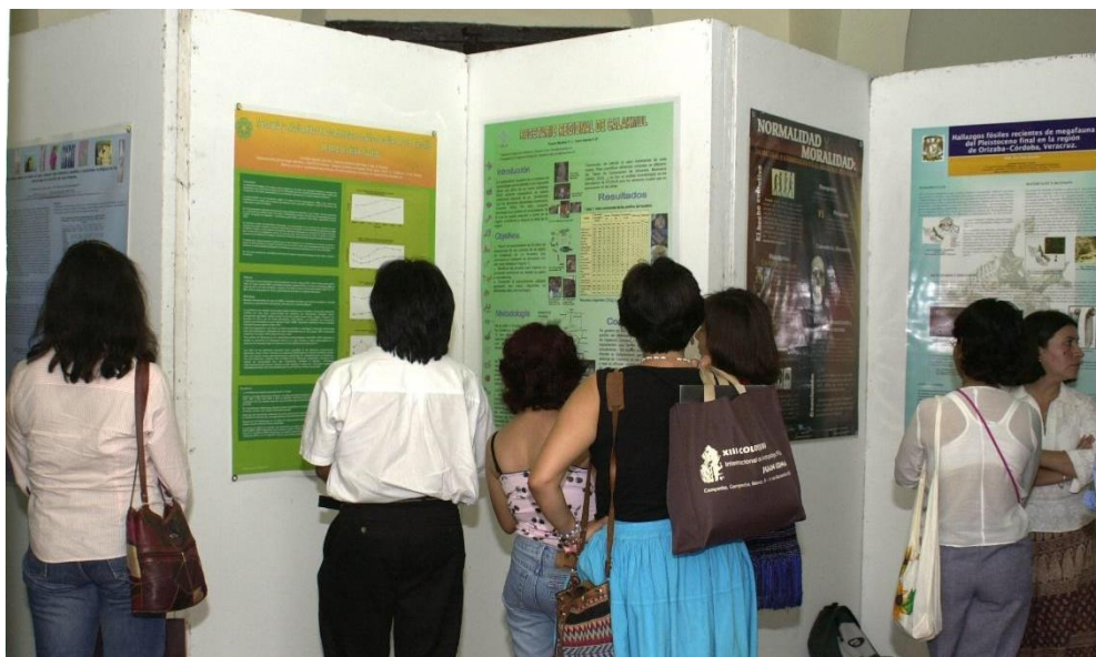
Exposición de carteles

A finales de este 2023, el Coloquio Internacional de Antropología Física “Juan Comas” cierra su círculo al regresar a la Ciudad de México (ahora nombre oficial de nuestra ciudad capital), una vez más a las inmediaciones del Bosque de Chapultepec, en las majestuosas instalaciones del Museo Nacional de Antropología. En esta versión vigésima segunda, este navegante desde el ya lejano otoño de 1986, con escaso equipaje pero nunca sin