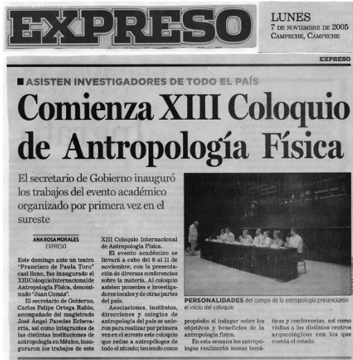
Noticia sobre la inauguración del XIII Coloquio de Antropología Física en el Diario Expreso, Campeche

participación decidida de investigadores ya no sólo de la UNAM, sino de otras instituciones más que dan cuenta del interés que despertó en la comunidad y la incorporación circunstancial pero decidida del Instituto Nacional de Antropología e Historia. 9