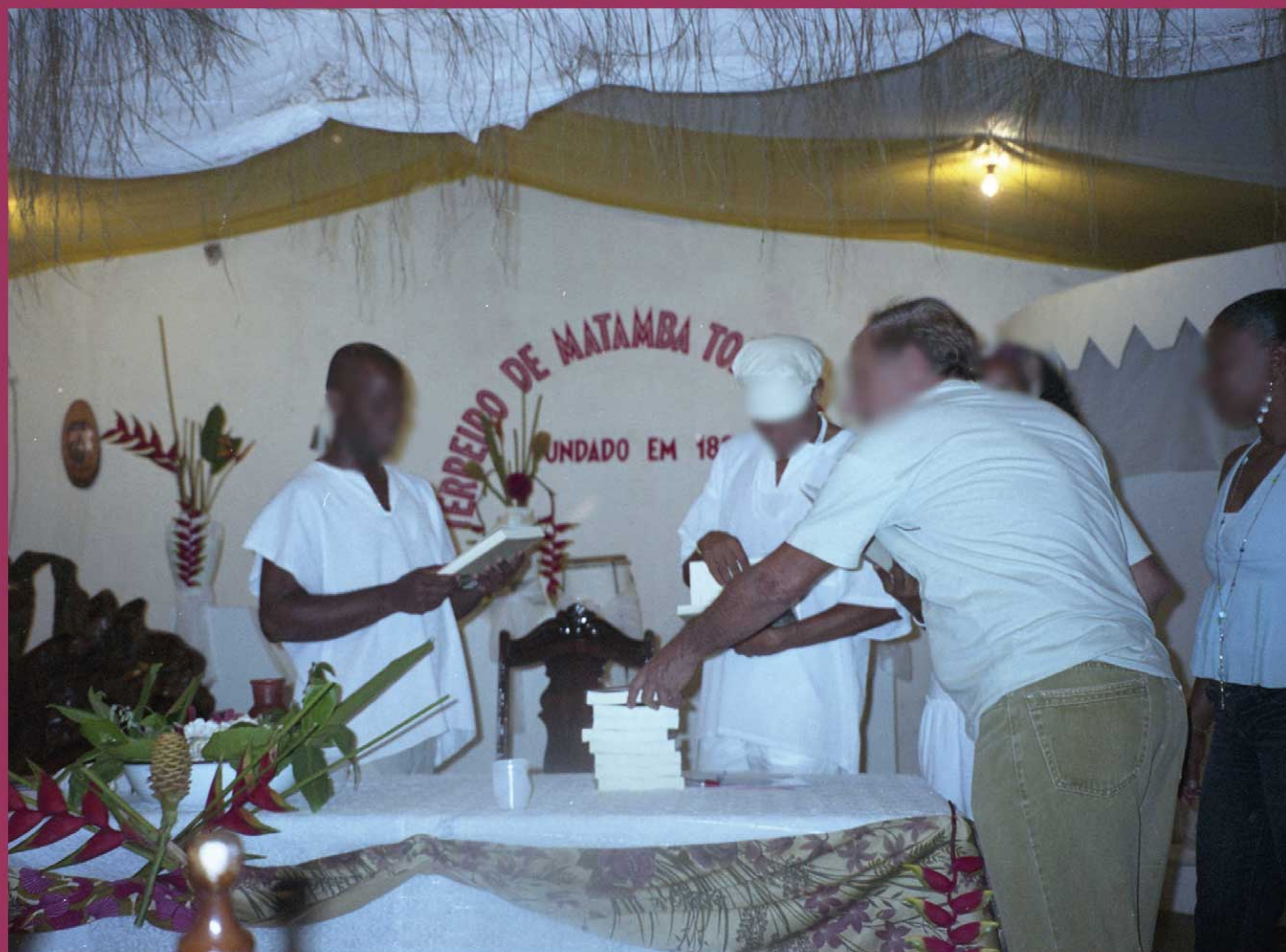
Imagen: Presentación de libro "Cómo Funciona a Democracia" en el Terreiro Matamba Tombenci Neto, Ilhéus-Bahia, 2006.

Actividades ilegales y extralegales y procesos de terraformación en territorios indígenas en México y América Latina