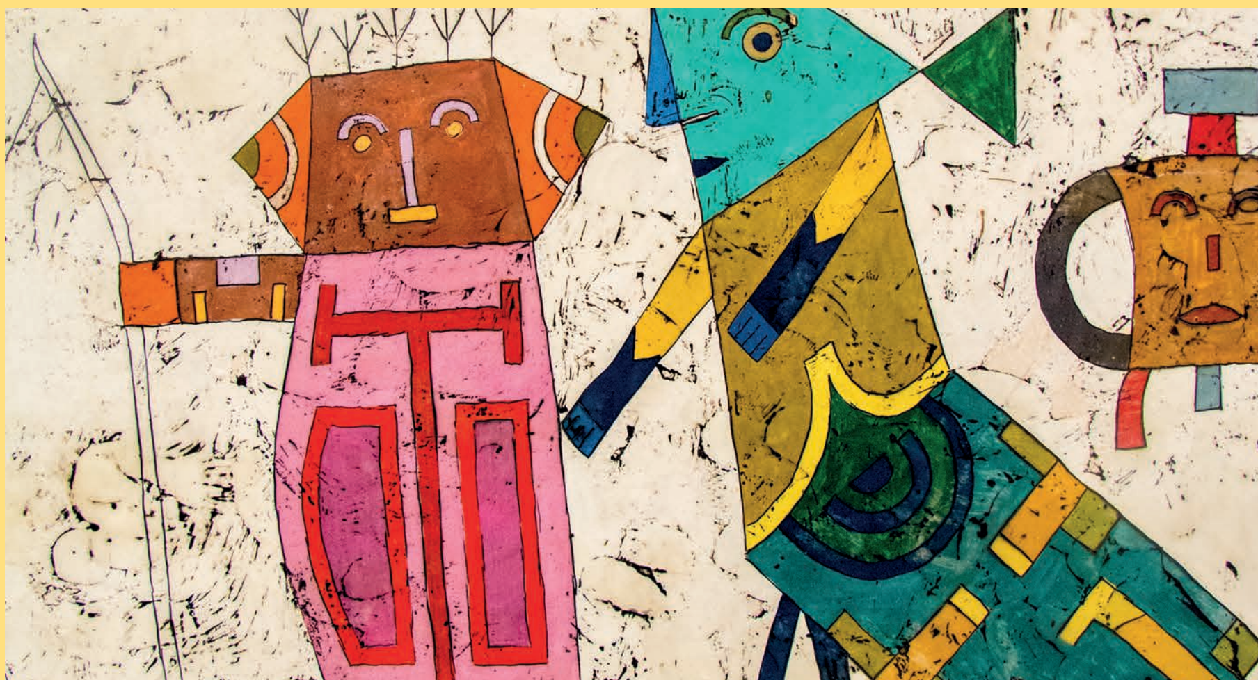
Imagen: "Detail - Prelude to a Civilization (1954)" by andrjn2006, licensed under CC BY-SA 2.0 Disponibile en https://openverse.org/image/230e595d-7d51-46c4-b626-44a7e57a5b7f?q=Native+american+Art&p=46

Para participar vía Zoom y recibir mayor información laboratorios.historia@gmail.com